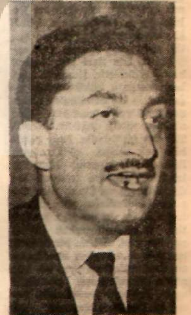
Bülent Ecevit Meydan okuyor

Geçen hafta bu ilgisizliğin günahını CHP ye yüklemek için AP li Başkan yardımcısı Ferruh Bozboylu, Çalışma Bakanını bir ara salondan kaybolmasını fırsat