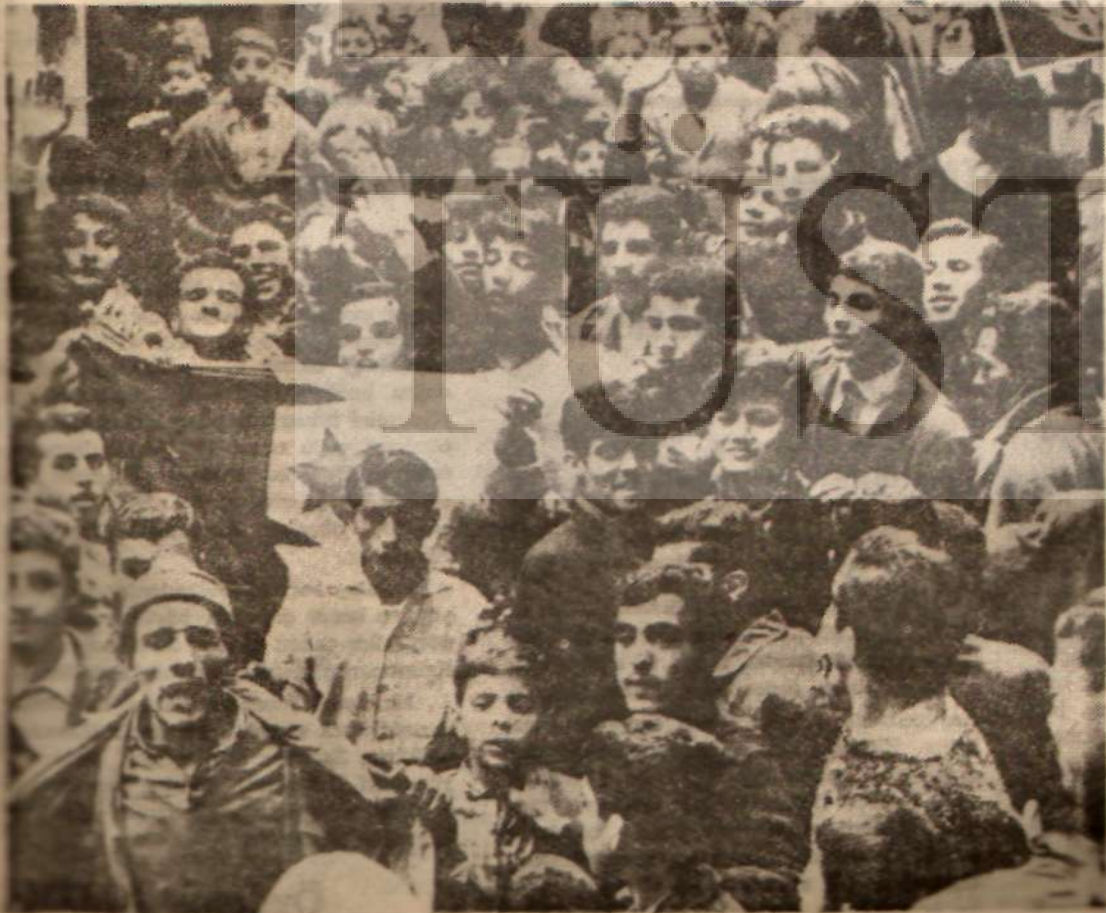
Cezayir'de bağımsızlık şenlikleri Mesiciler yeni yeni ortaya çıkıyor

Arapları küçümsemekten, hor görmekten artık vazgeçmeli ve çağımızın uyanığına ayak uydurmalıyız.