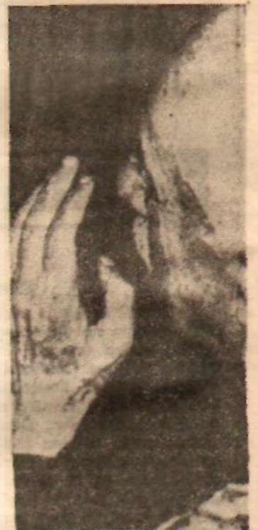
Başbakan İnönü O da itham edilmişti

Bakanlar bu bilginin ışığı altında, İstanbul'da son zamanlar da yayınlanmakta olan yarı Kürçe yarı Kürçe bir derginin üstünde durdular. Kabinenin hukukçu üyeleri Kürçe yayımlanan derginin durumunu yeni Anayasamıza göre suç olmadığını açıkladılar. Nasıl bir Türk vatandaşı Fransızca, İngilizce veya Almanca dergi ve ya gazete çıkarabiliyorsa, aynı