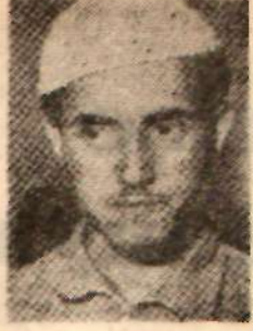
İhlef Ahmet Patronun yerini aldılar.