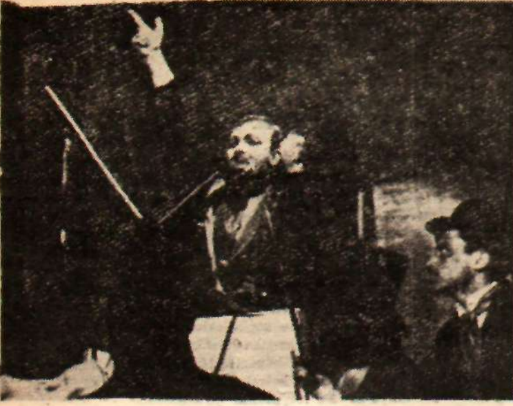
Kayıp Mektup'ta politikacılar