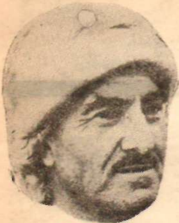
Molla Barzani Etkisi oluyor