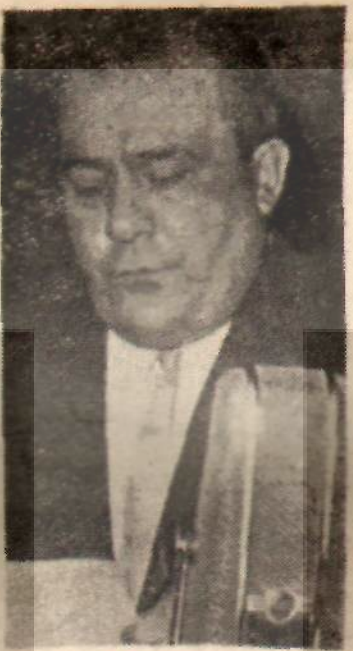
İlyas Seçkin Soygun nasıl önlenir

İş bu safhaya gelince, devleti soyma faaliyeti başlar. Adına organizatör denilen İstanbul Teknik Okul mezunu, orta boylu düz kır saçlı bir mühendis faaliyete geçer. Organizatör, ihaleye iştirak edecekleri toplar. Bu toplantıda ihaleyi alacak olan kimseler ile onun öteki müteahhütlere ve organizatöre ödeyeceği sus payı