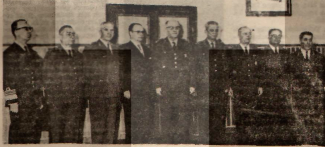
Milli Güvenlik Konseyi Hükümeti uyardı

Bu açıklamalar karşısında B.M.M. nin 19.11.1951 tarihli açık oturumunu hatırlamaya